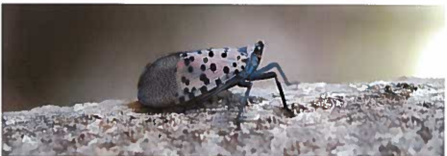
Mosca linterna con manchas adulta

Además, la alimentación del insecto puede provocar que la planta supure, provocando un olor a fermentado y los insectos de por sí excretan grandes cantidades de fluidos (miel de rocío). Estos fluidos promueven el crecimiento de moho y atraen a otros insectos.