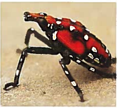
Las ninfas se vuelven rojas Justo antes de convertirse en adultas.