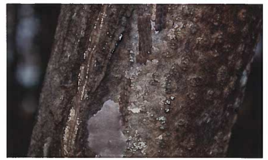
Conjuntos de huevos eclosionados y no eclosionados