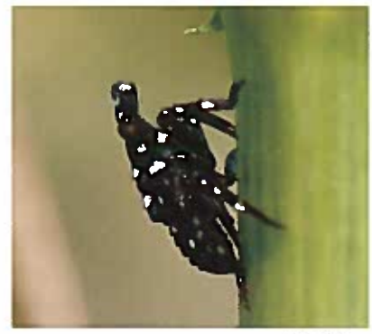
Las ninfas son negras con manchas blancas en las etapas tempranas del desarrollo.

Para encontrar un especialista de extensión cercano, visite el sitio en red del Departamento de Agricultura de los EE. UU. (USDA) en www.nlfa.usda. gov/Extension. Un directorio con la lista de los funcionarios estatales de regulación de plantas se encuentra disponible en el sitio de la red de la Dirección Nacional de Plantas en www.nationalplantboard.org/membership.