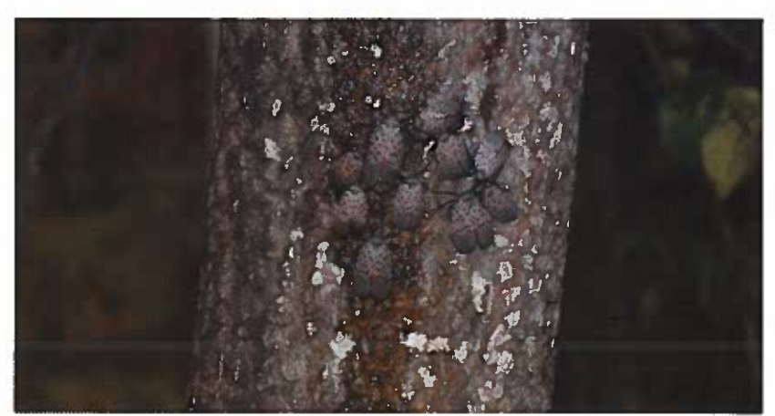
Grupo de adultos en el tronco de un árbol a la noche

APHIS 81-35-024S Emitido en noviembre de 2014